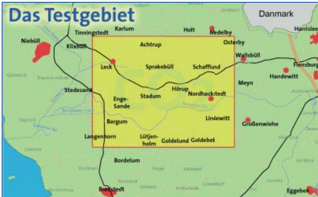
Grafik RWE-DEA - Bearbeitung: SSW