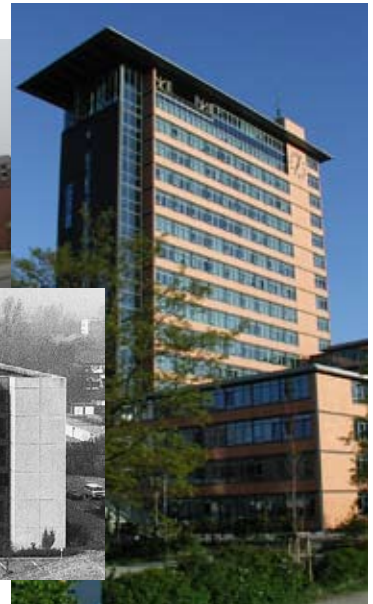
Sollen zukünftig eng zusammenarbeiten: Die Kreisverwaltungen in Schleswig und Husum und das Rathaus in Flensburg.