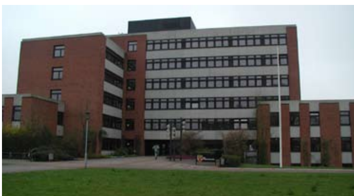
Draußen vor: Die Kreisverwaltung in Rendsburg würde durch die neuen Verwaltungsregionen wahrscheinlich Richtung Süden ausgerichtet, während die anderen Nord-Kreise zusammenwachsen würden. Für den SSW und die dänische Minderheit eine verhängnisvolle Entwicklung.

Dithmarschen orientiert. Der SSW legt deshalb Wert darauf, dass bei einer engen Zusammenarbeit der Kreise die historischen Grenzen des Landesteil Schleswig berücksichtigt werden.