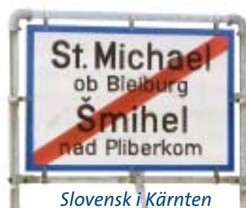
Slovensk i Kärnten

- i enkelte tilfælde kan der også opstilles offentlige vejvisere til institutioner, der har en direkte relation til regional- eller mindretalssproget.