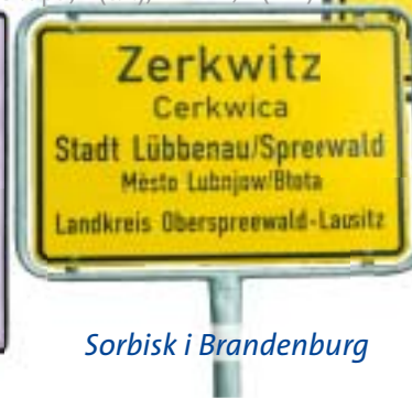
Sorbsk i Brandenburg