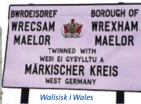
Walisisk i Wales