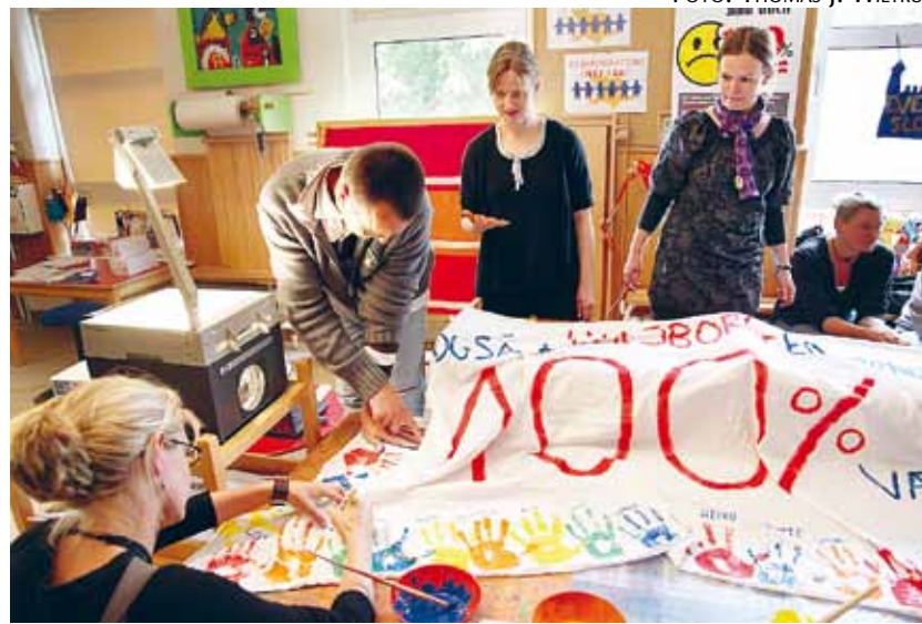
De kæmper også i Lyksborg. Forældre mødte talstærkt op på et møde i mandags og fremstillede banner til protestaktionen den 26. juni.