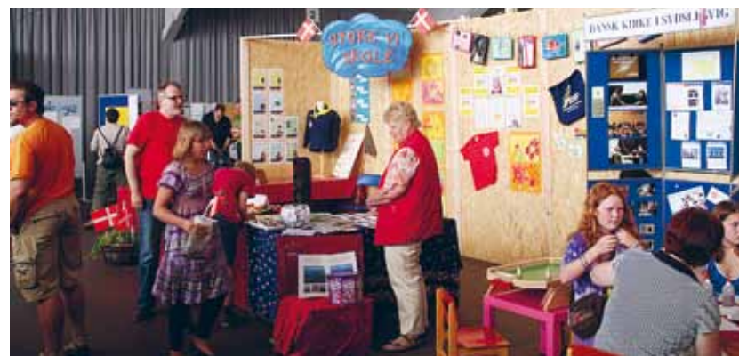
Ved de danske stande på HGV-messen kunne gæsterne blandt andet få informationer omkring Skoleforeningens igangværende kampagne.