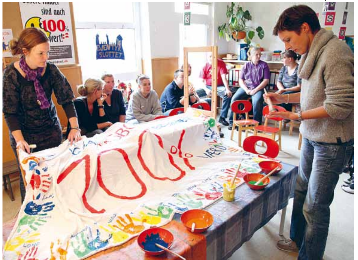
Rundt om i Sydslesvig er forberedelserne til demonstrationerne den 26. juni i fuld gang. Her er det forældre fra børnehaven i Lyksborg, der laver bannere.

- Dette er en meget alvorlig sag for hele mindretallet, så det er vigtigt, at vi får fortalt omverdenen, at der må være en grænse for, hvad regeringen i Kiel kan gøre mod os. Og jo flere vi er ved demonstrationerne, desto større gennemslagskraft har vi. Så derfor: Brug lørdag den 26. juni i en god sags tjeneste, siger formanden.